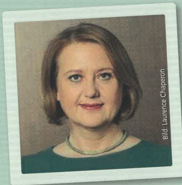
Lisa Paus , Bundesministerin für Familie, Senioren, Frauen und Jugend